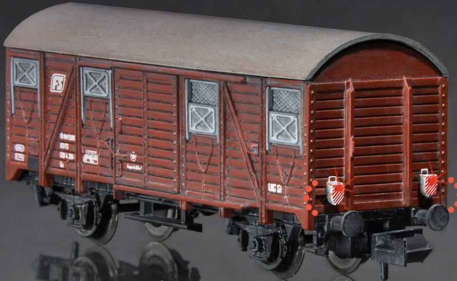
Carro coperto FS, serie Gs, con fanali posteriori in coda ai treni a luce lampeggiante