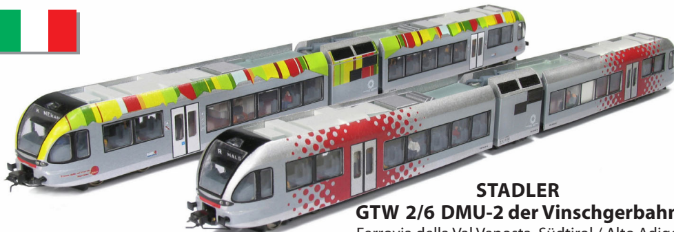
STADLER GTW 2/6 DMU-2 der Vinschgerbahn Ferrovìa della Val Venosta Südtirol / Alto Adige