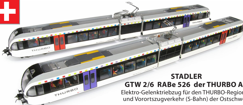
STADLER GTW 2/6 RABe 526 der THURBO AG Elektro-Gelenktriebwagen für den THURBO-Regional- und Vorortzugverkehr (S-Bahn) der Ostschweiz