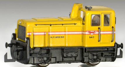
Bauzug- und Rangier-Kleinlok "WIEBE"

Etliche der bis heute noch zahlreich verbliebenen Loks sind bei div. Privat- und Werksbahnen im Einsatz, z.B. im ÖBB Eisenbahnmuseum Strasshof (2060.04 im Ursprungszustand), bei der Österreichischen Gesellschaft für Eisenbahngeschichte.