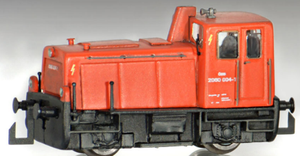
ÖBB 2060 004-1 Rangierlok mit alt-orangeroter Farbgebung und Beschriftung, wie sie bis in die 1990er Jahre zu sehen war