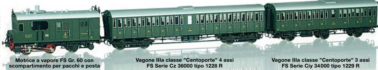
Motrice a vapore FS Gr. 60 con scompartimento per pacchi e posta