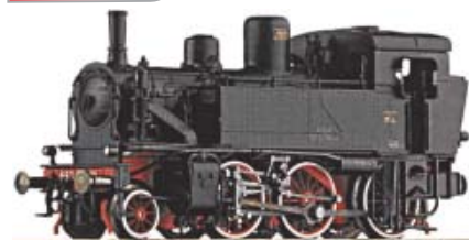
Esempio tipo (H0)