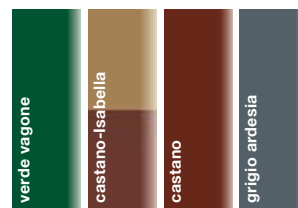
Tabella storica dei colori del materiale rotabile FS

Informazioni dettagliate in merito ad ogni modello, moduli d'ordine dei prodotti FINESCALE e l'ultima versione dei nostri prospetti in formato file PDF da scaricare comodamente, modelli speciali, kit di ottone ed altro le trovate nel sito Internet www.finescalemuc.de oppure nei nostri prospetti, disponibili in formato PDF su CD o stampati, che Vi invieremo volentieri: