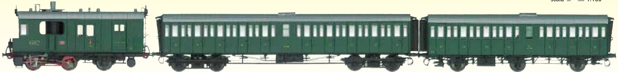
Motrice a vapore FS Gr. 60 con scompartimento per pacchi e posta