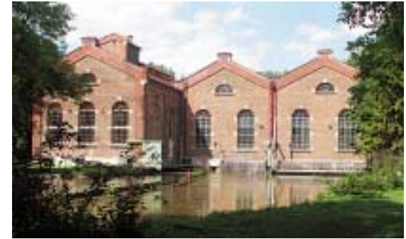
Foto a destra: vista dei ultimi edifici di MAFFEI oggi (centrale elettrica "TIVOLI" con il famoso "Eisbach")

Le locomotive ultimate vennero trasferite alle officine centrale della K.Bay.Sts.B. sul "Marsfeld" a Monaco, nella zona dell'attuale tra Hackerbrücke e Donnersberger Brücke, trainato da molti cavalli passando per il "Englischer Garten" e parte della città, cosa che ogni volta fu un'attrazione popolare. Nel "Englischer Garten" ancor oggi si può osservare un ponticello rafforzato per il passaggio delle locomotive.