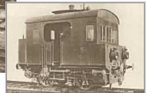
Fotografie storiche dell'originale