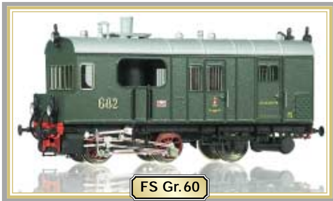
FS Gr. 60